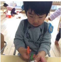
上手に切れるかな？