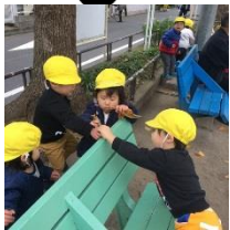
お店屋さんごっこ