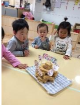
クリスマスケーキ作り