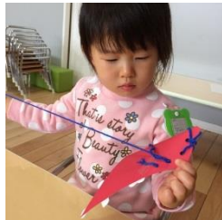
サンタさんの洋服作り