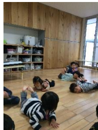
「ほくらもできるよ。」