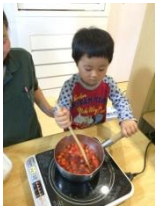
収穫した苺でジャム作り