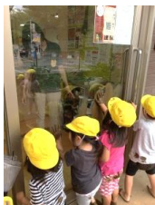
芸術は爆発し続ける