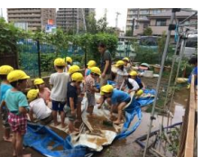
プールありがとう！