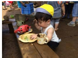
あわ組もどろんこ遊び