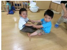
リズム体操 おふね