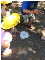
鈴を置いて蟻がくるのを待っています