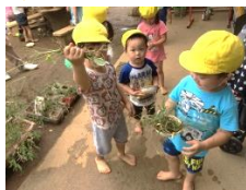
草取りしてままと