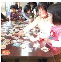
憩いの家で、カルタ取り