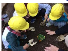
「お花にかけないで。」