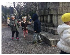
みんなでかけっこ