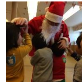
サンタさん来たよ～！