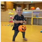
おばけブーム来てます！