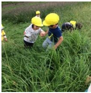
大丈夫？こっちだよ！