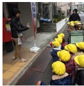
ポストに入れたよ！